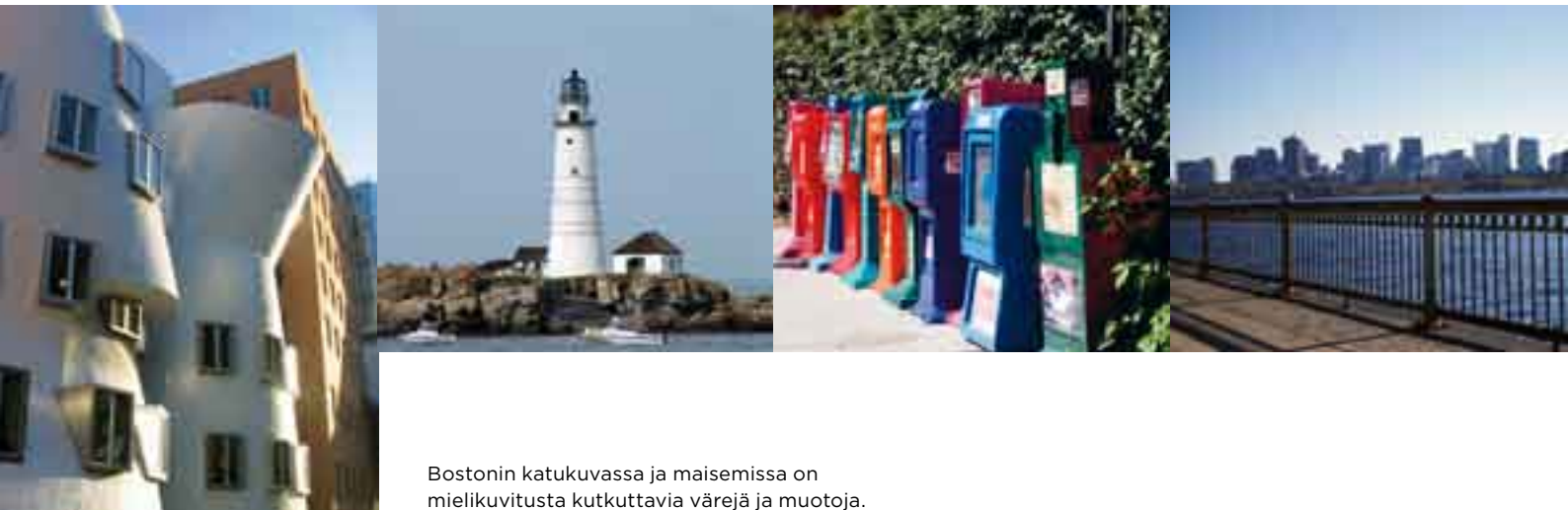
Bostonin katukuvassa ja maisemissa on mielikuvitusta kutkuttavia värejä ja muotoja.

nykyään ensimmäistäkään koulua, Court Streetin (Tuomioistuimenkadun) varrella ei ole minkäänlaista tuomioistuinta, Dock Squarella (Telakka-aukiolla) ei ole telakkaa ja juuri mainitusta Back Baysta (Takalahdelta) on turha etsiä lahtea – se on täytetty kauan sitten. Myös Water Street (Vesikatu) on kuiva kuin beduiinin sandaali.